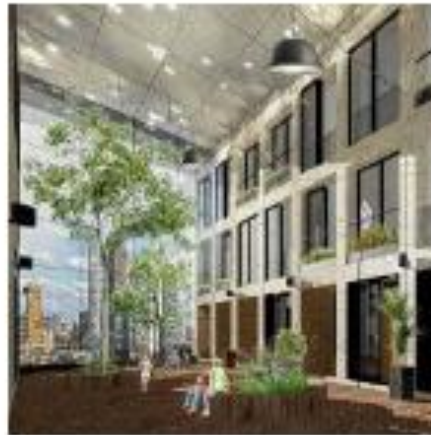
Inclusiviteit: aandacht voor collectieve ruimtes