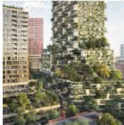
Architectuur: ruimte voor natuurinclusiviteit