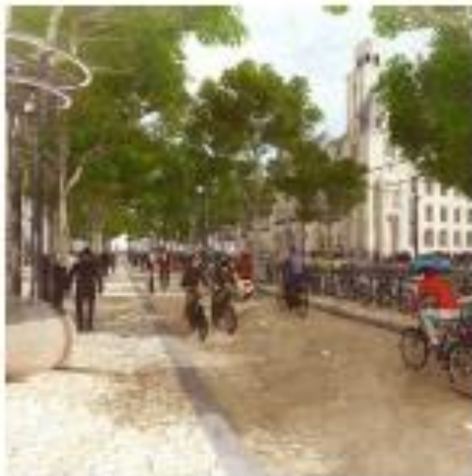
Buitenruimte: ventweg transformeert naar breed fietspad en trottoir