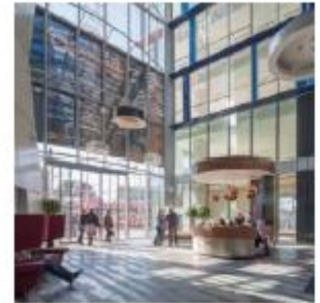
Inclusiviteit: ontmoeting tussen bewoners wordt gestimuleerd