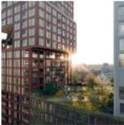
Dak: het daklandschap doet mee in de levendigheid van het gebouwconcept