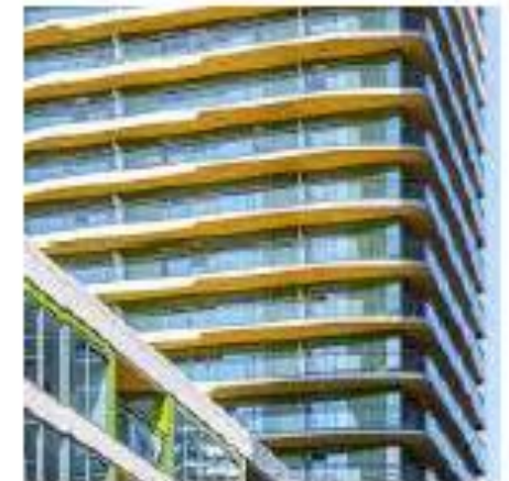
Architectuur: licht, luchtig, transparant, vriendelijk en menselijke maat