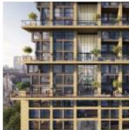
Architectuur: balkons dienen onderdeel te zijn van het totale gevelontwerp