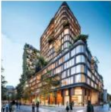
Architectuur: onderbouw sluit aan op gebouwen in de omgeving