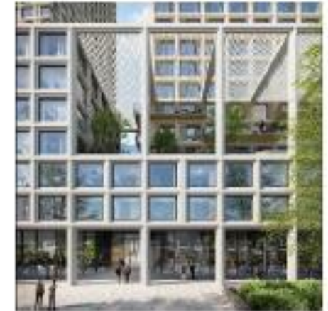
Architectuur: aangename en actieve plint