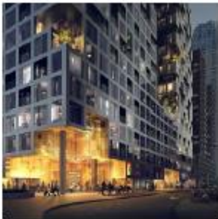
Architectuur: duidelijk herkenbare entrees