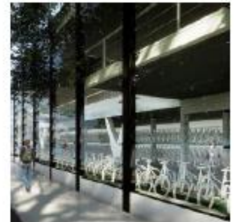
Plint: aandacht voor kwalitatief hoogwaardige fietsenstalling in de plint