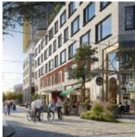
Plint: interactie met publieke ruimte